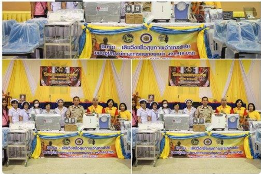
รับมอบเครื่องมือทางการแพทย์